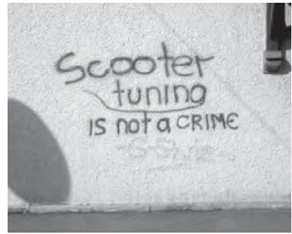
[Links] und [oben] Kunst und Kritzelei

kann beides sein. Die Sprühdose ist nur das Werkzeug. Was damit gemacht wird, wie und wo sie zum Einsatz kommt, ist entscheidend. Graffiti ist viel zu komplex und vielschichtig, um es so einfach zu kategorisieren.