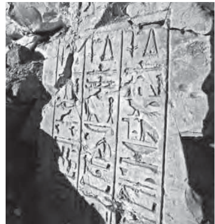
Hieroglyphen wurden in Stein gemeißelt und standen entweder für Wörter oder Wortteile (anstatt Lauten). Da es sich meist um Auftragsarbeiten handelte, können sie nur in Ausnahmefällen als Graffiti verstanden werden.

Auf dieser Seite finden sich einige Beispiele für historisches Buchstaben-design. Das Bild unten zeigt einen religiösen Text aus dem Mittelalter. Oft wurde das erste Wort jedes Kapitels oder Abschnitts mit kunstvoll ausgestalteten Anfangsbuchstaben, den sogenannten Initialen, versehen. Ihr Aussehen erinnert in einigen Bereichen bereits stark an moderne Graffiti-Buchstaben und weist viele Übereinstimmungen mit moderner Buchstabengestaltung auf. Das Bild unten rechts ist ein Beispiel für die gotische Schrift, auch Textur genannt. Durch den Einsatz einer Kalligrafiefeder mit einer breiten Spitze variieren die Linienstärken je nach Bewegungsrichtung.